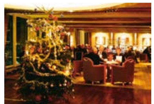
WEIHNACHTEN AN BORD